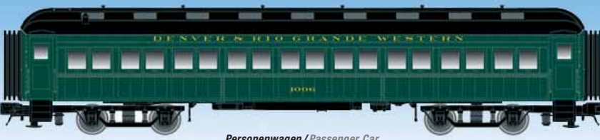
Personenwagen / Passenger Car