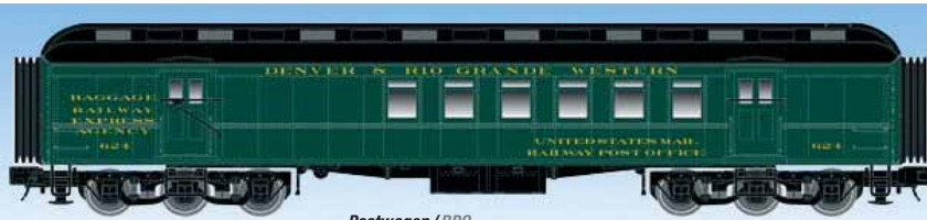
Postwagen / RPO