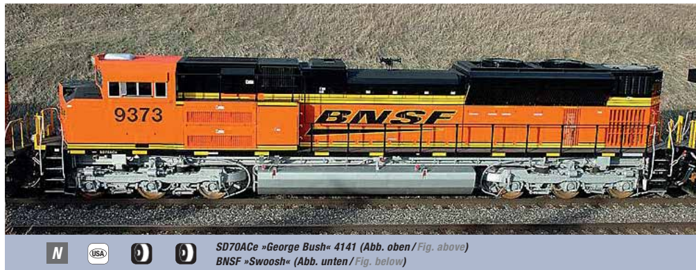
N USA SD70ACe »George Bush« 4141 (Abb. oben / Fig. above) BNSF »Swoosh« (Abb. unten / Fig. below)