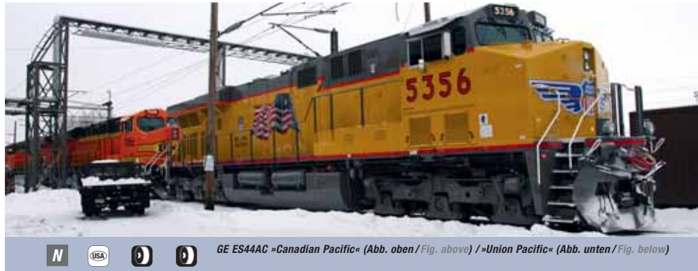
N USA GE ES44AC »Canadian Pacific« (Abb. oben / Fig. above) / »Union Pacific« (Abb. unten / Fig. below)