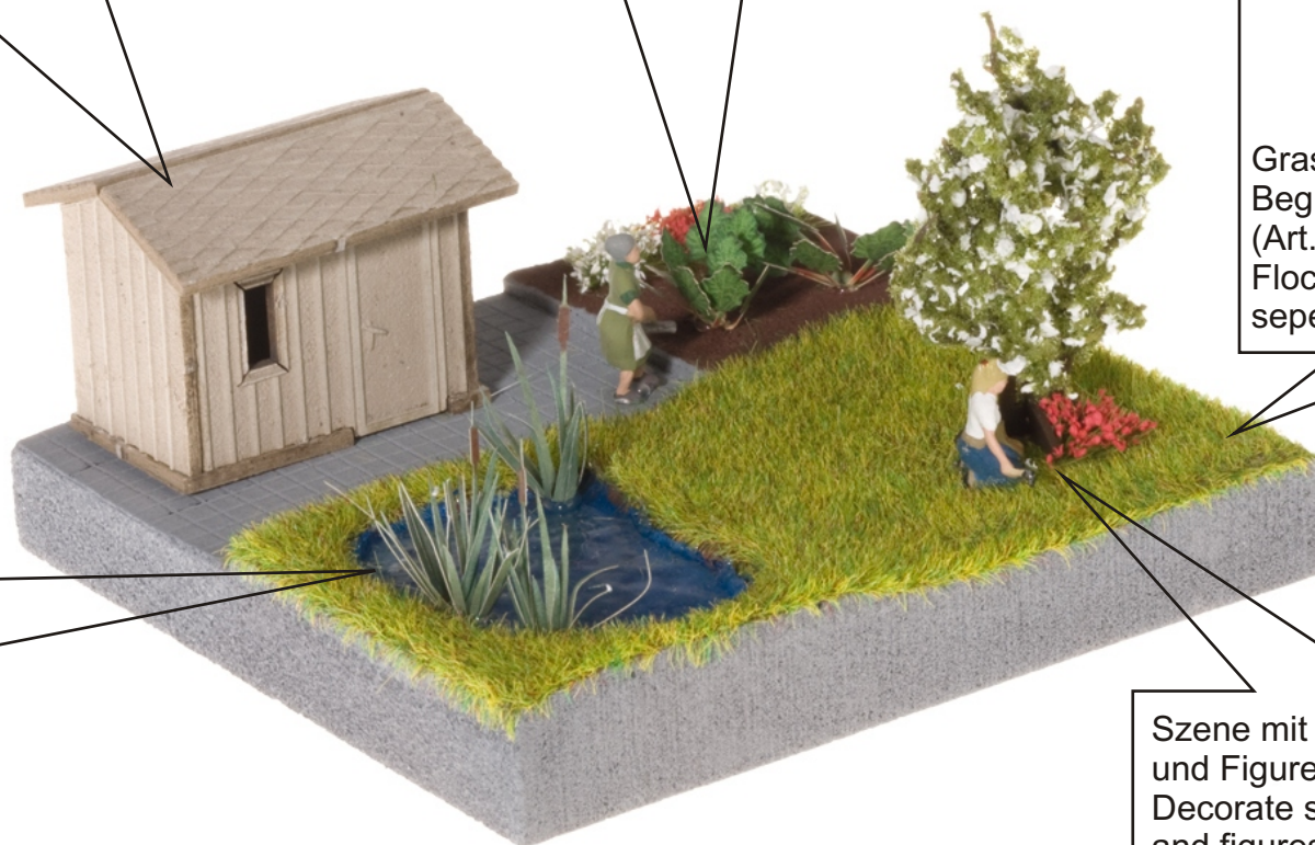
Szene mit Gras-BüscheIn, Baum und Figuren ausgestalten. Decorate scene with grass tufts, tree and figures.