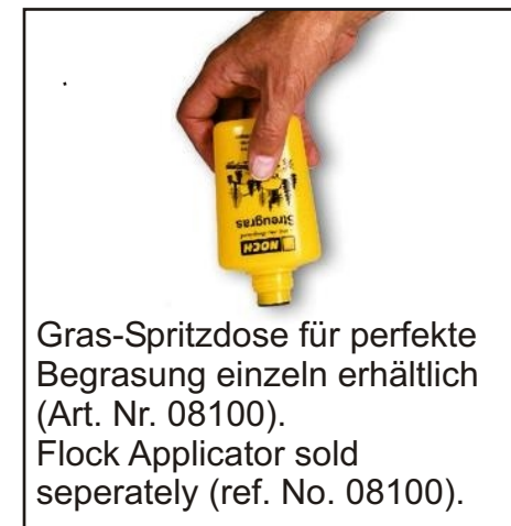
Gras-Spritzdose für perfekte Begrasung einzeln erhältlich (Art. Nr. 08100). Flock Applicator sold seperately (ref. No. 08100).